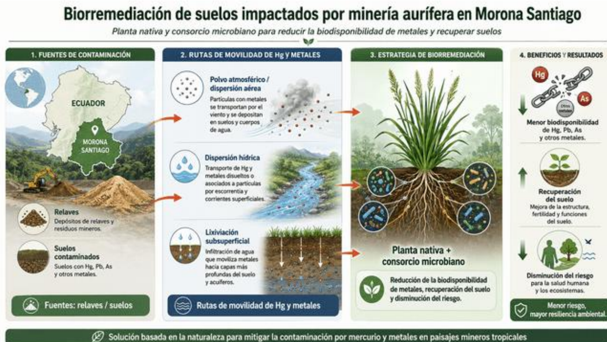
Figura 2. Propuesta de ruta aplicada para Morona Santiago

Nota. Propuesta derivada de la síntesis narrativa; no representa un resultado directo de campo.